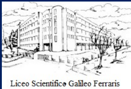
Liceo Scientifico Galileo Ferraris

Rete CPPC Varese Scuola capofila LSS "G. Ferraris" Varese