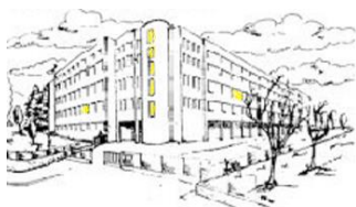
Liceo Scientifico Statale "G. Ferraris" di Varese